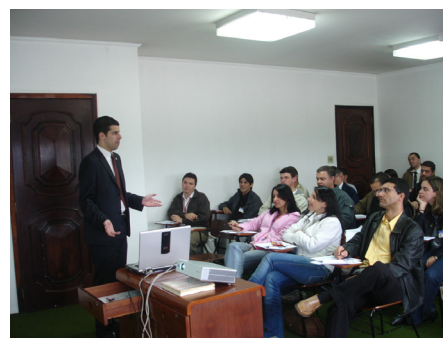
Funcionários durante treinamento

Durante os dias 28 e 29 de agosto, cerca de setenta funcionários da área comercial da Viação Cometa participaram da 3ª etapa do Treinamento de Líderes, cujo objetivo é aprimorar e capacitar profissionalmente aqueles que hoje exercem a função de liderança e também daqueles que poderão vir a assumir esta posição.